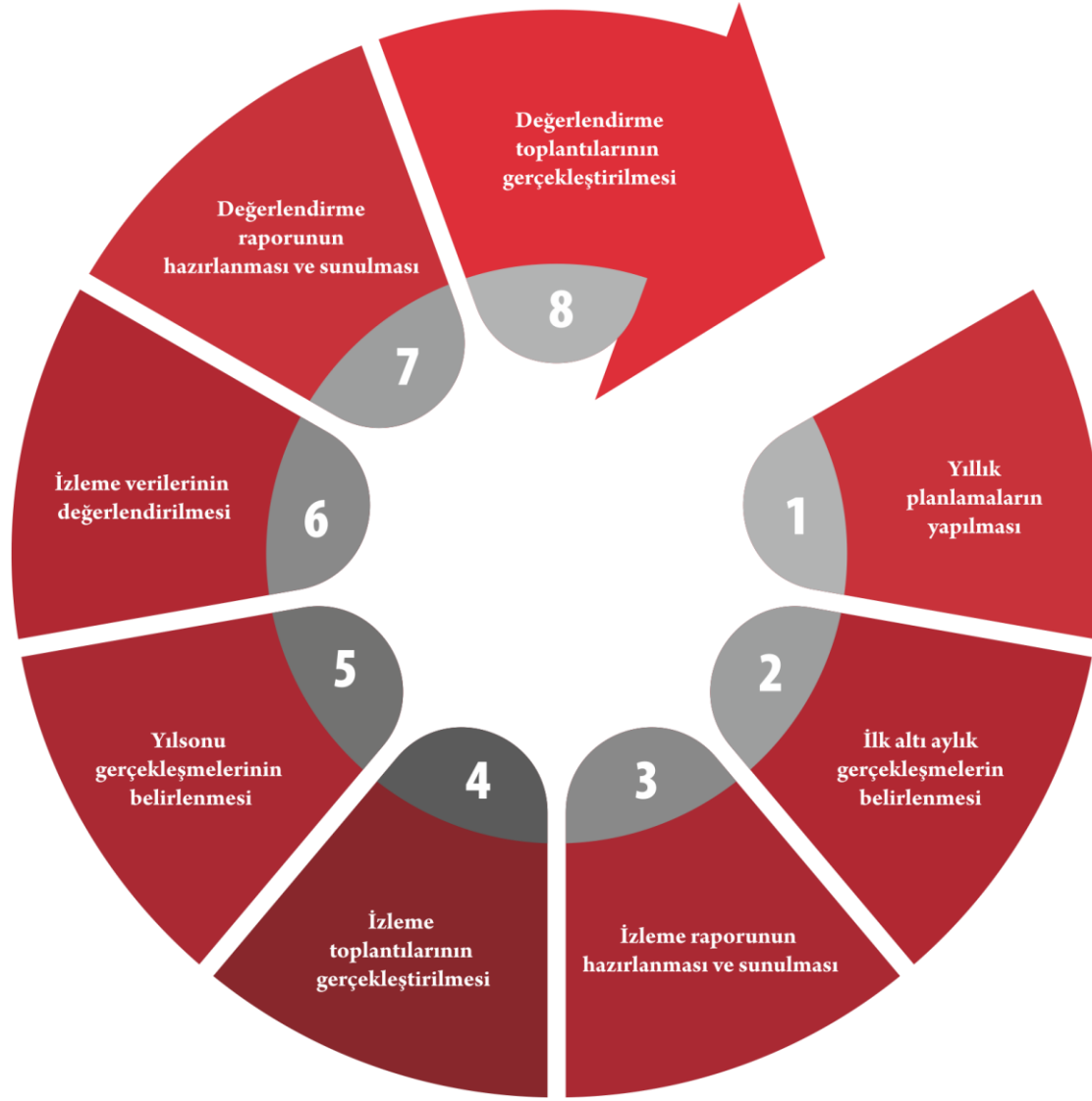
Şekil 2. İzleme Değerlendirme Süreci